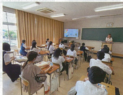
※写真は夏のオープンスクールのような様子です。