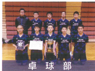
卓球部 全国高校選抜大会出場決定