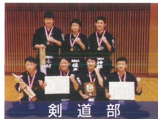
剣道部 茨城新聞社旗争奪全国高校剣道大会3位