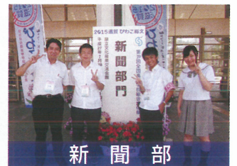
新聞部 2016総文祭出場決定