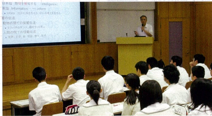
模擬講義は「情報」に関する内容で、とても興味深かったです。